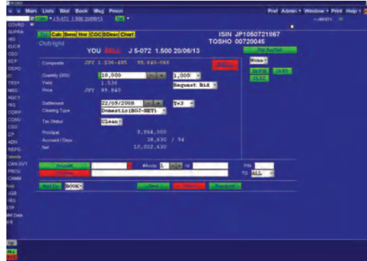
トレードチケット画面